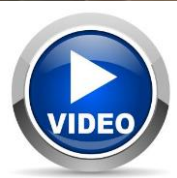
Scellage BIOPAP® SI 24 sur ligne Mondini Cigno