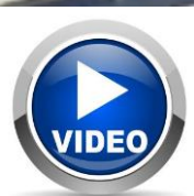
Solutions BIOPAP® en ligne pour la liaison froide surgelée