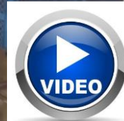
Solutions BIOPAP® en ligne robotisée pour la liaison froide