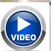
Scellage bol BIOPAP® en ligne pour salades fraîches premium