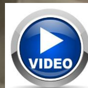
Solutions scellage BIOPAP® en ligne pour plats préparés surgelés